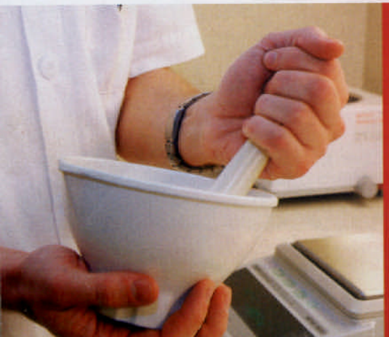
V galenskem laboratoriju se niso izjasnili, zakaj so na nekatere izdelke, ki niso njihovi, nalepili znamko Lekarna Ljubljana.